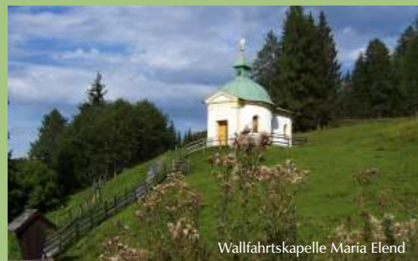
Wallfahrtskapelle Maria Elend